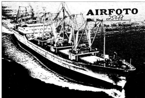
A Radnóti a Malakka-szoroshan, S.L. ezrel hajózat körül a Földet.