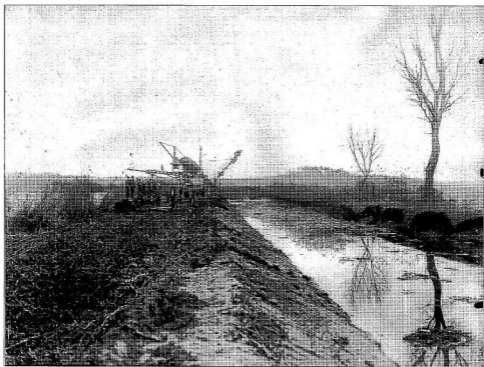
A Dunavízlgyi Főcsatorna építése 1926.