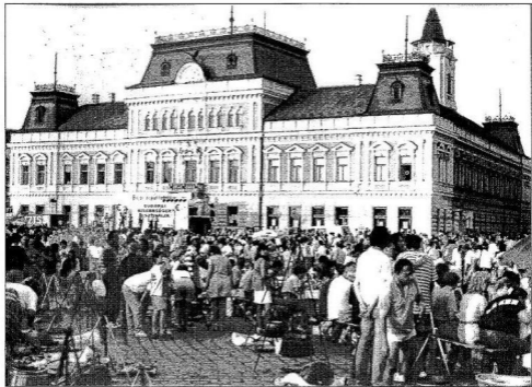
Az idei haltrézfűzés is jól sikerült