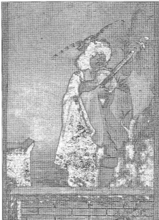
Egy fénykép a múlt századból — Goldstein Márk műterméből