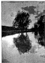
TÜKRÖZŐDÉS 1910. (Mentényi Sándor)