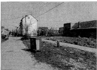
A régi után, az új előtt

– Az egyetemen eközben hogy boldogultál?