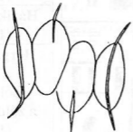
Scenedesmus armatus var. bajaensis UHERKOV.

(Baja, Kamarás-Duna, 1956) Limnológia = ótán (őe itt: nem tengeri vizek biológiai kutatása)