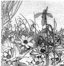
Tóth Pál grafika