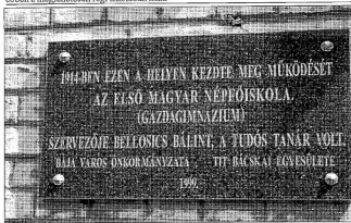
Emléktáblát avattak április 27-én a Bajaszécsényi Általános Iskola falán

Miért is jó dolog festéssel foglalkozni? Többek között azért, mert festeni lehet akkor is, amikor hűvös és esős idő van, ha meg vagyunk fizva, ha áradnak vagy apadnak a folyók, vagy éppen semmi másuk nincs kedvünk. A többi maradjon tőlek.