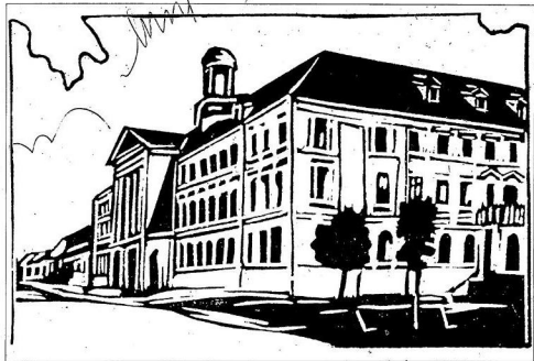
A várnegyzei színházaja Baján /Éber Sándor rajza/