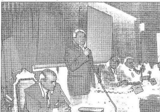
Fül-, orr- és gégészorvosok tudományos ülésének megnyitója