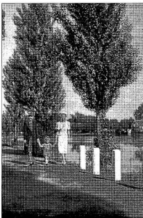
Séta a Szentjános úton 1941-ben nagyvíznél