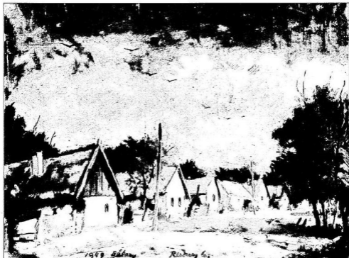
Rudnay Gyula: Bábony (1949)