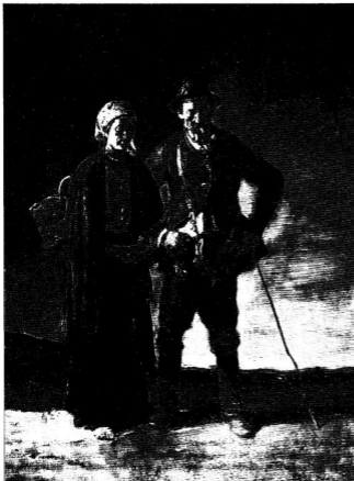
Gömböri öreg parasztháaspár (1917)

Rudnay világa eddig föl nem tárt, ismeretlen világ, amiről eddigi méltatói nem szóltak. Meg sem kísérelték Rudnay művészetével kapcsolatba hozni. E világból leghatározottabban Bartók és Kodály merítettek, s a még megmenhető ősi kincsünk tárbázisából elejtett gyöngyszemeket mutatott meg.