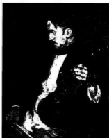
Pihenő hegedűs (1913)