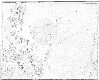
Képeink a Mars-sorozat két alkotása