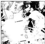
Hetven strófa az ifjúságról