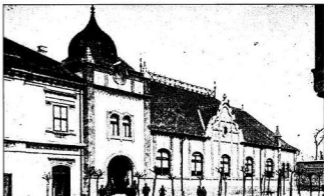
A Takarékpénztár tér a század elől

A Takarékpénztár tér rendezésének kiadá-