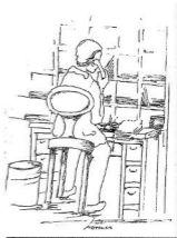
A szerző illusztrációja