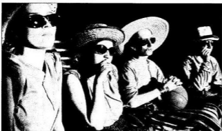
A „csonka csapat” kemény magja