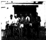
A későbbi összeesküvők diákként

beni szervezkedés igényét. Az osztályharc mesterséges élezeze megtette hatását: egyre többen érezték, „ És így nem lehet tovább! ” De míg a kommunisták és szövetészek maguk mögött tudták a győztes Szovjetuniót, a világ legnagyobb, legkeresőbb szárazföldi haderejét, ellenzékének nélkülöznie kellett minden számottevő nyugati segítséget. Amit kaptak, alkalmatlan volt a legcsekélyebb eredmény elérésére is.