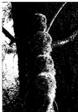
Fák és madarak

A madarak és fák napja 1945 után lassan feledésbe merült. Az 1945–49 között kiépülő, majd 1989-ig hatalmon lévő kommunista rendszer amerikai eredete és a Horty-korszakban betöltött szerepe miatt eltűnt. A természetvédelem hosszú időre kikerült a közoktatási programból, a természetvédő egyesületek távol kerültek az oktatási intézményektől. A rendszerváltás előtt, 1987-ben merült fel ismét a természetvédelem és egy iskolai ünnepség összekapcsolásának gondolata, a természetvédelmi nevelés az 1990-es évektől fokozatosan egyre hangsúlyosabb szerepet tölt be az iskolák pedagógiai programjában. A madarak és fák napját május 10-én ünnepeljük, e napot a termé-