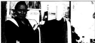
Három színel szalagozott kancellári talár

Angela Merkel, Németország kancellárja a Szegedi Tudományegyetem díszdoktorra lett 2015. február 2-án Budapesten. Az egyetlen számára a díszdoktorok körének meghatározása, azaz ilyen címek adományozása megfontolt és tudatos tervezés eredménye. Olyan személyeket részesítenek doctor honoris causa címbe, akiknek munkássága, tevékenysége, tudományos eredményei illeszkednek az adott egyetem hitvallása és célkitűzései, valamint társadalmi szerepvállalása által fémjelzett értékek szövetébe, s ezáltal a díszdoktor személye egyben erősíti