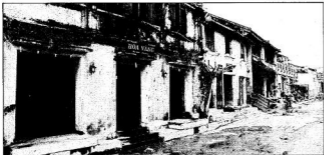
Még látszanak az árvíz nyomai

csappant, bár az 1990-es években tapasztaltak egy fellendülést, amikor az élénkült turizmus átalakította a helyi gazdaságot. A mai Hoi An ismét egy kozmopolita olvasztótégely, Vietnam egyik leggazdagabb, idegenforgalmi szempontból legfontosabb városa, egy kulináris Mekka. Az óvárosban még mindig lehet látni néhány dűldező japán kereskedőházat, kínai templomot és ősi teatrakart, de természetesen a helyi lakossági épületek és a rizsföldek helyét mára turisztikai vállalkozások – bárók, hotelek, utazási irodák és szabóságok – vették át.