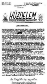
Az illgaldás lap egyetlen fennmaradt példánya

Készítések, célok, remények Mind a két szervezkedés indításként fontos szerepet játszottak a családi, rokonsági kapcsolatok, a közös keresztesélet élményei. Hasonlóan fontos volt az iskolai múlt, tanúlással-tanítással, kirándulásokkal; a tanárok egyéniségek és megnyilvánulási. A III. Bélába járók esetében a vizületip élet romantikája, a közös sportolás, balok, az első szerelmek emléke. A bizalmas beszélgetések: életről, jövőről, a ma utódoosorban a politikáról, a háborús készületéről. A fegyveres küzdelem remélt következményeiről: a revízió mértékéről, a keresztényszocialis elvek