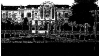
A városi kórház évtizedekkel ezelőtt

Fotó: A bajai kórház milleniumi évbúnyja