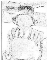
Nem eléggé behűtött kókusztej

Délután háromkor elindultunk végre reggelizni és város nézni. Hoi Ant az útkönyv Vietnam leghangulatosabb városának tarja. Egykor fontos kikötőként működött, emiatt még mindig számtalan építészeti kincsel bűszkélkedhet, amelyek többé-kevésbé épségben megmaradtak, mivel a forgalom