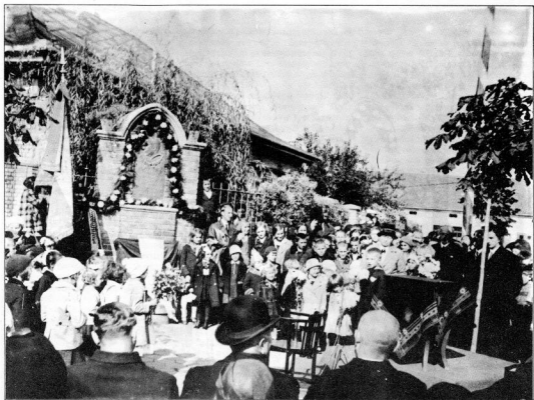
A KLÉBELSBERG EMLÉKTÁBLA AVATÁSA. A KISCSÁVOLYI ÓVODA SARKÁN VOLT A DOMBORMŰ, VISSZAHELYEZÉSÉT A KÉPVISELŐTESTÜLET SZORGALMAZZA