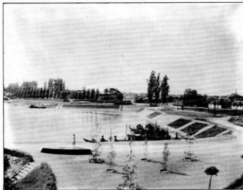
A SUGOVICA KÖRNYEZETÉT A HARMINCAS ÉVÉK VÉGÉN RENDEZTÉK UTOLJÁRA

1978. december 30-án, életének 85. évében hunyt el Budapesten. Elvezetése a hazai és nemzetközi tudományos életben,