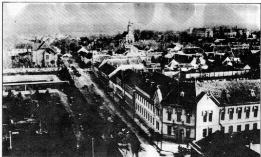
LÁTKÉP A VÁROS KELETI RÉSZÉRŐL, A HUSZÁS ÉVEKBŐL

Duna medervonala felett az aknákat felrobbantani. Nem sok sikerrel. A németek uszályokon szállították a romániai benzint a német hadsereg és a hadiipar számára. E konvojok sértetlenül haladtak rendeltetési helyük felé, mivel az uszályok mágnestelenítve voltak, de sok magyar uszály futott aknára. Nagyrésztüket az 1950-es években „emelték ki”.