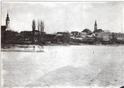
A DELY-FÉLE FATELEP A POSVÁNYOS FELŐL