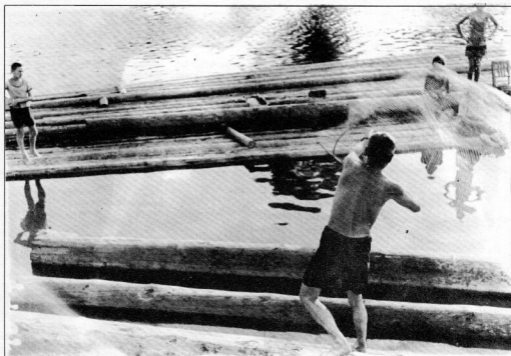
A FATUTAJOKRÓL HALÁSZNI IS LEHETETT A SUGOVICÁN

hengerek (2–2 db fogta be a rönköket és a fűrészek le-fel mozgással vágták fel a rönköket, amit minden ütemnél automatikusan húzott előre.)