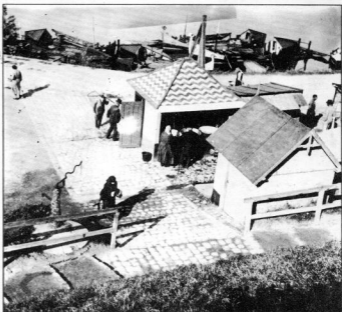
A RÉGI HALPIAC