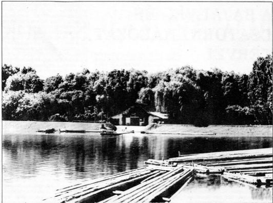
A SUGOVICA, SZÉPSÉGES KORÁBAN

sítának, háromszor annyiba kerülne a fenntartás, mint jelenleg.